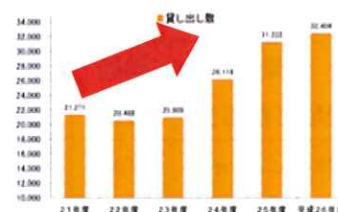
【貸出し冊数の推移】

また図書取次との相乗効果を狙い、利用者増と貸出し冊数を伸ばしていきます。広報活動にも引き続き取り組んでいきます。